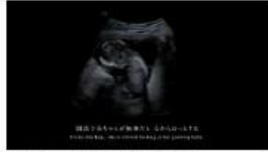
T: 健診で赤ちゃんが無事だと 心からほっとする