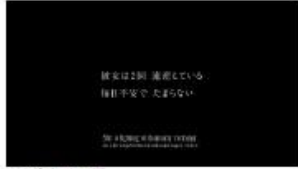
T: 彼女は2回 流産している 毎日不安で たまらない