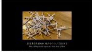
T: 出産まで約400本 痛みをこらえて注射する