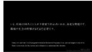
T: いま、妊婦の20人に1人が 不育症であるともいわれ、身近な問題です。 職場や社会の理解がまだまだ必要です。