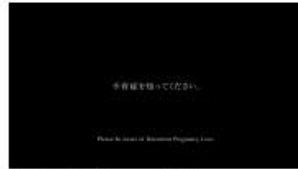
T: 不育症を知ってください。