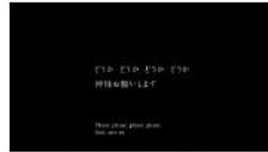
T: どうか どうか どうか どうか 神様お願いします